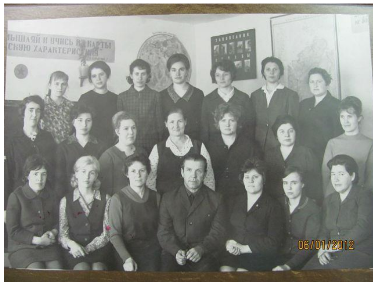
Фото 2. Коллектив учителей 1970 -1971г.

В школе круглогодично работал кружок юннатов, ребята занимались кролиководством, выращивали цыплят, работали на пришкольном участке. Выращивали капусту, томаты и другие овощи, цветы.