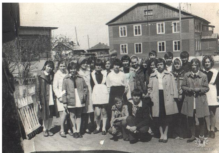
Фото 1. На заднем плане здание интерната.