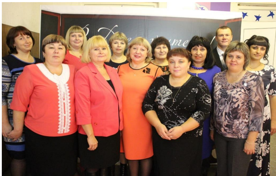
Фото 2. Учителя работающие в нашей школе сегодня